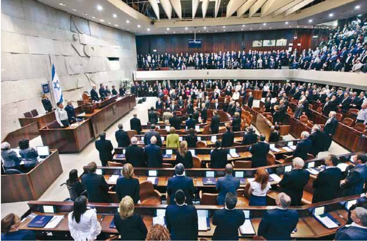
הכנסת, אתמול. האם שררה כאן אנרכיה, לית דין ולית דין, שהייתה את מנהיגיו לחוקק לחוקק לחוקק?

הכותב הוא מומחה לארה"ב, ראש ביה"ם לתקשורת וחוקר בכיר במרכז בס"א למחקרים אסטרטגיים באוניברסיטת בר אילן